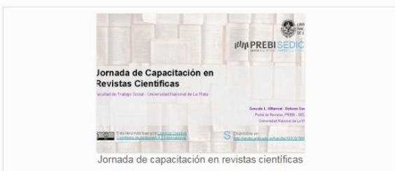
Jornada de capacitación en revistas científicas

A continuación, se comparten las presentaciones de los cursos y de las capacitaciones que dan los integrantes de CESGI, tanto para editores de revistas como para autores, investigadores y estudiantes de doctorados.