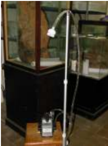
Fig.5: Dispositivo de muestreo, bomba aspirante conectada a sistema de cassetes.