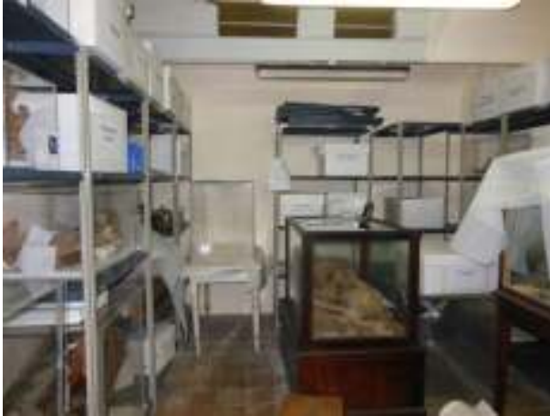
Fig. 2: Depósito de restos momificados (subsuelo Museo de Ciencias Naturales).