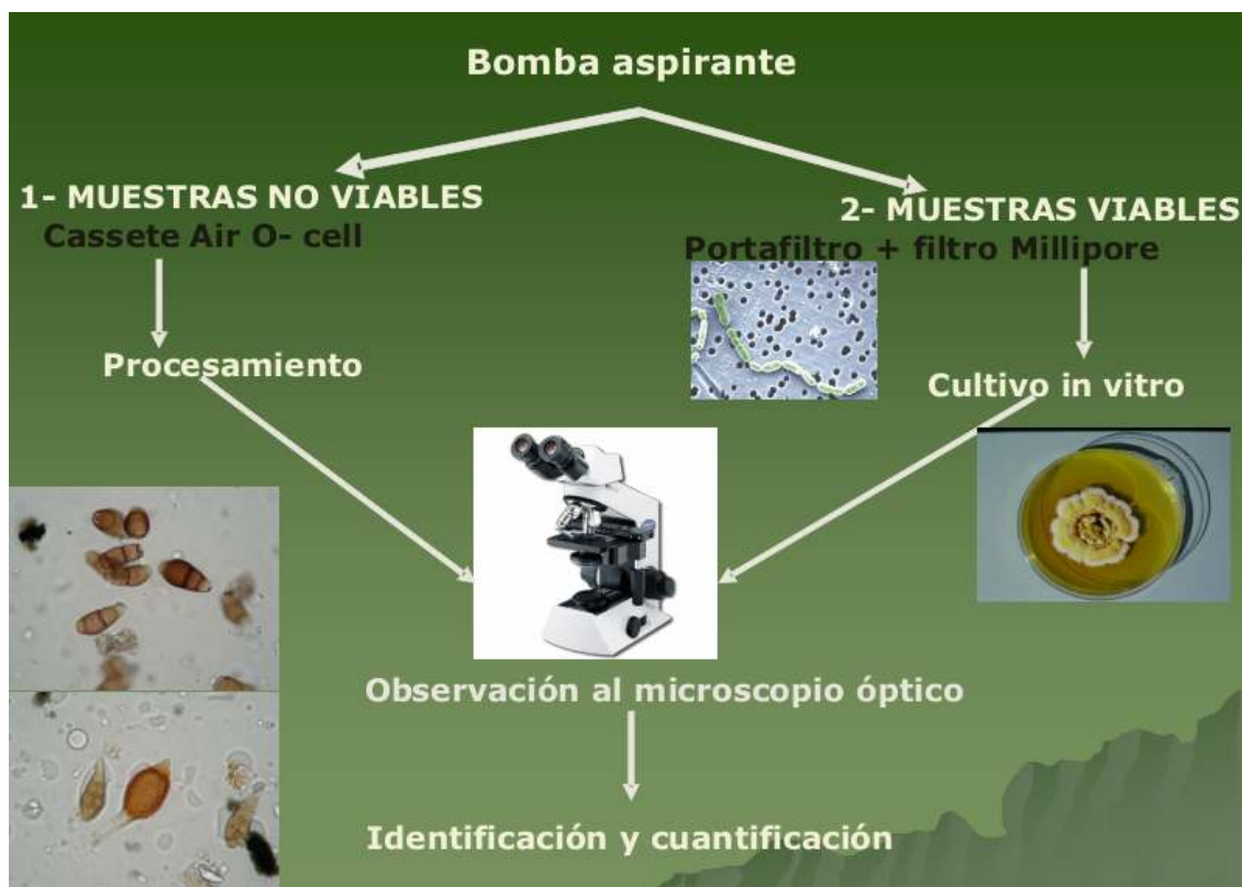
Fig. 4: Diagrama de flujo de la secuencia de muestreo de aire interior

En el momento de la toma de muestras, se registró la temperatura y humedad en cada recinto utilizando HOBBO U14 LCD Data logger.