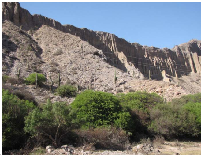
Figura 3: Terrazas Terciarias de Huajra

Está ubicado sobre la Ruta Nacional N° 9, en el paraje conocido como Huajra. La característica de este punto es el fuerte cambio de paisaje dado por el ensanchamiento de la playa del Río Grande permitiendo una mayor visibilidad. Viniendo desde el sur por la Ruta Nacional N° 9 se llega al primer mirador, Esquina de Huajra. Desde allí se puede observar las terrazas terciarias de Huajra (Figura 3), un sitio arqueológico con gran influencia incaica, el fondo del valle del Río Grande hacia el norte, y la Quebrada de Punta Corral de gran significado por la celebración de Semana Santa