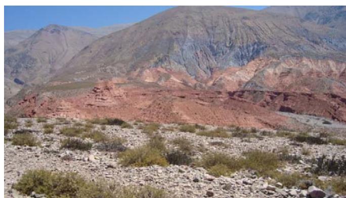
Figura 7: Formaciones geológicas mirador 4

Continuando por el camino de tierra, hacia el oeste, y después de sortear una cuesta de fuerte pendiente, se llega al paraje de Raya-Raya.