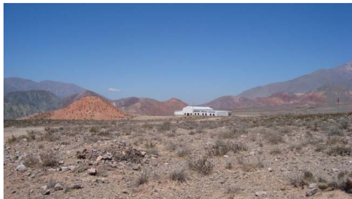
Figura 6: Vista del Mirador 3

Regresando por el mismo camino, se transcurre una distancia aproximada de 3 km hasta llegar a la Quebrada de Tumbaya Grande, desviándose a la izquierda por un camino vecinal de tierra, hasta llegar cerca de la Escuela N° 377, en un lugar llamado “el morro”, que en si mismo constituye un mirador interesante (Figura 6).