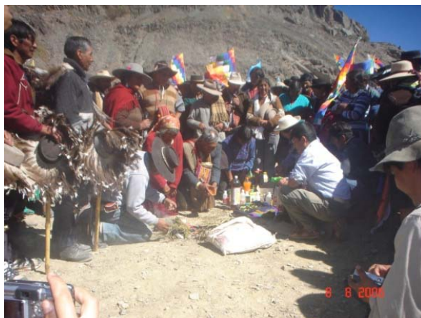
Figura 8: Pachamama Finca Tumbaya Grande

Encuentro entre familiares y vecinos de caseríos y/o pueblos cercanos donde se realiza la faena de señalar a los animales que han nacido en el año, cabras y ovejas. Antes de cortarles la oreja de una manera determinada se los "enflora" o adorna con lana de diversos colores, entretejida en la lana de los animales. Previamente se distribuye chicha, cigarrillos, coca y llicta a los invitados.