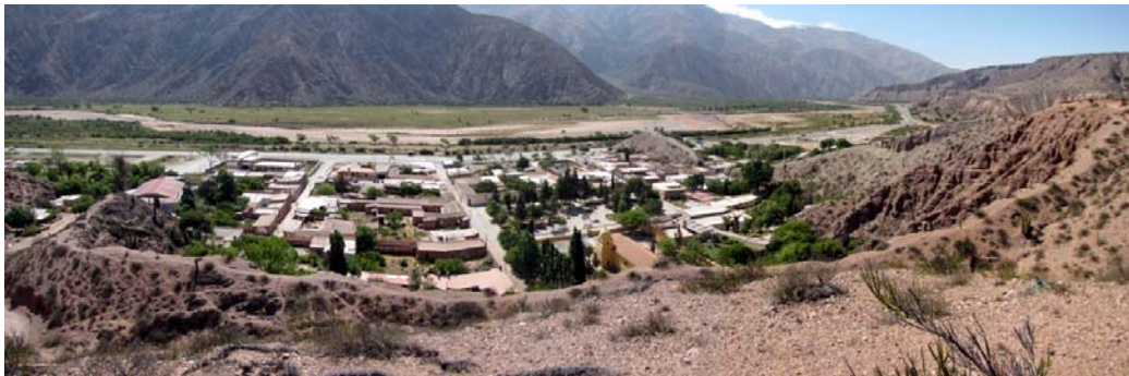
Figura 5: Vista panorámica desde el Mirador 2

Caminando hacia el norte por la calle Coronel Quintana se llega hasta el acceso al Cementerio. Este es un camino estrecho, muy empinado, que llega hasta la parte alta del pueblo donde se ha dispuesto el cementerio. Este lugar se constituye como un mirador excepcional que permite tener una visibilidad en los 360° (Figura 5). Desde allí se puede admirar el paisaje natural en todo su esplendor: la Quebrada de Tumbaya, las dos cadenas montañosas que contienen el valle del Río Grande y diversas formaciones geológicas. También se tiene un panorama completo, desde arriba, del pueblo y sus extensiones urbanas hacia el norte y el sur. Se puede observar su periferia donde se va conformando un área rur-urbana, donde aparecen espacios destinados a actividades deportivas y a actividades agrícolas asociadas a las viviendas. Algo más lejos, mirando hacia el norte aparece el sitio arqueológico denominado Agua Bendita.