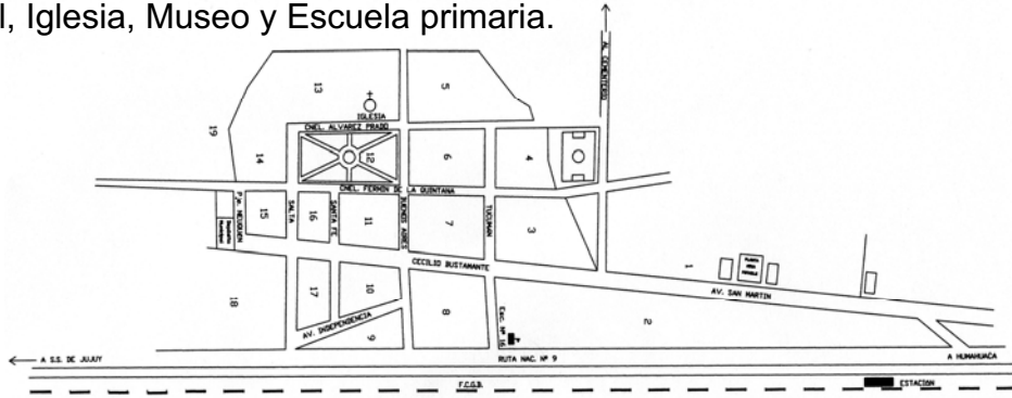
Figura 4: Plano planta del área urbana de valor

Continuando por la Ruta N° 9, a una distancia aproximada de 2 km, se llega al Pueblo de Tumbaya. Es conveniente dejar el vehículo al costado de la ruta, e ingresar a pie. Se ingresa por la calle Salta, en el extremo sur del centro histórico. Se camina dos cuadras, por una calle estrecha con viviendas tradicionales hasta desembocar en la plaza, centro neurálgico de la vida del pueblo. Ésta se encuentra rodeada por la mayor cantidad de edificios públicos: Comisión Municipal, Casa Parroquial, Iglesia, Museo y Escuela primaria.