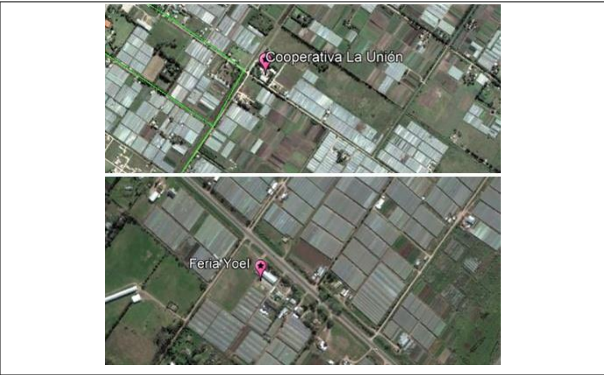
Imagen n°2: Detalle del entorno de las ferias.