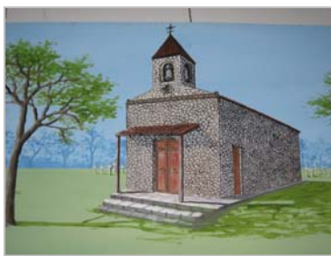
(Fig. 5) Fotocopia de una pintura de la primitiva capilla.

Por causas del deterioro se perdió uno y los restantes fueron restaurados en 1990.