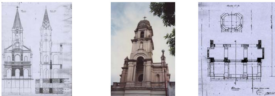
Fig.11) Fachada y corte, foto actual y planta torre

Respecto de la torre se recomienda en los pliegos que su estructura sea de madera de pino tea y la cubierta de pizarra francesa de primera calidad según se aprecia en la fachada y corte que se muestra. (Fig.11) sin embargo finalmente se debió realizar la torrecilla de argamasa en forma de tejuelas.