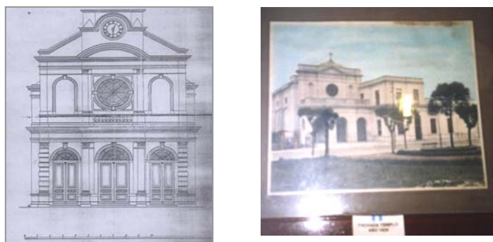
(Fig.10) Proyecto fachada y cuadro con foto

puede inferirse que la iglesia contaba con un nartex que remataba en una azotea con balaustre al modo de la arquitectura post-colonial de neto lenguaje neoclásico (Fig.10)