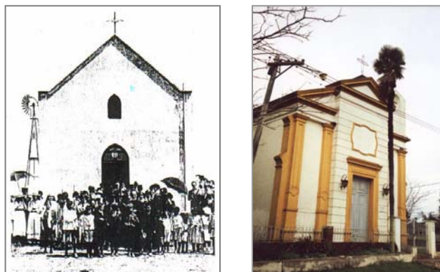
(Fig.16) Foto primitiva capilla y posterior modificación.

Tipologías: De nave única del tipo salón.