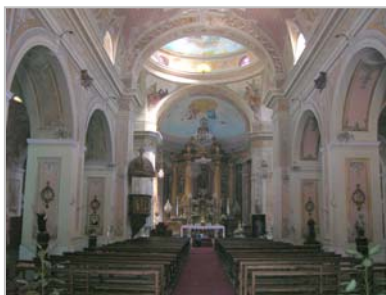
(Fig.3) Interior templo

Morfología interior: La nave mayor tiene una cubierta de bóveda de cañón corrido que descansa en forma pesada a través de pilares y arcos de medio punto. (Fig.3)