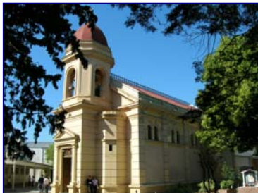
(Fig.13 Exterior templo)

Corriente estilística: Exteriormente Italianizante, interiormente es de la corriente estilística del tardo renacimiento, con profusión de decoración.