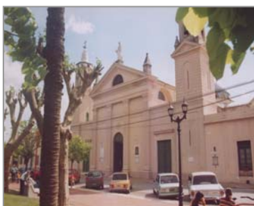
(Fig.2) Iglesia Ntra.Sra.de Magdalena