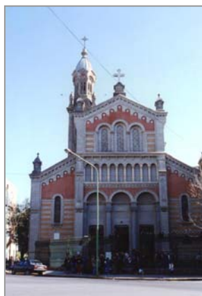
(Fig.15) Fachada Templo

Corriente estilística: ecléctica. Estilo neo románico (del norte de Italia) con las características guardas horizontales o Lombardas y elementos paleo- cristianos.