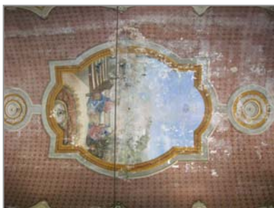
(Fig.4) Pintura bóveda nave central

algún personaje bíblico o pasaje del evangelio. Pinta ocho pasajes bíblicos en paredes y techos.