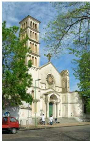
(Fig.14) Exterior templo

Corriente estilística: Estilo neo románico, forma parte de un conjunto edilicio mayor (Convento y colegio). (Fig.14)