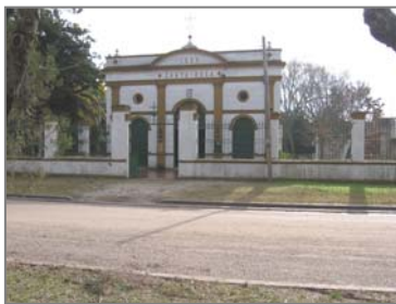
(Fig.7) Capilla Santa Rosa Atalaya

Tecnología: Muros exteriores de mampostería portante con pilares y cubierta de techo de chapa de zinc a dos aguas que no se evidencia desde la fachada