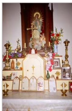
(Fig.5) Parte frontal de la casona (Fig.6) Altar del oratorio

Corriente estilística: Perteneciente en cuanto a su lenguaje a lo que se dio en llamar arquitectura post-colonial, con la torre-mirador al frente en el cuerpo central con balaustre y cubiertas planas.