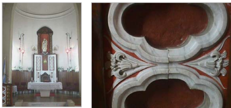
(Fig.18) Altar actual y partes comulgatorio primitivo

Como por ejemplo parte del comulgatorio (el detalle del mármol) que puede verse ahora en el ambón o el Cristo Crucificado, que sí es una escultura fundacional, aunque antes estaba sobre una pared.