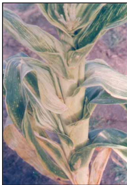
Figura. 2. Planta de maíz con síntoma de Corn Stunt Spiroplasma: Acortamiento de entrenudos y bandas cloróticas en hojas.

Corn plant with symptoms of Corn Stunt Spiroplasma: red leaf borders.