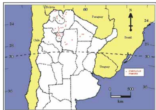
Figura 5. Detección de Dalbulus maidis desde la campaña 1991/1992 hasta 1999/2000.

Detection of Dalbulus maidis from 1991/1992 to 1999/2000 period.