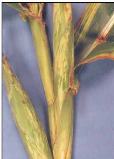
Figura. 3. Planta de maíz con síntoma de Corn Stunt Spiroplasma: Espigas múltiples y deformadas.

Corn plant with symptoms of Corn Stunt Spiroplasma: Shorted internodes and chlorotic bands in the leaf.