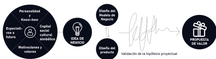
Figura 1 - Esquema del proceso emprendedor.

En base a lo expresado, sostenemos que el emprendedorismo en Diseño es un proceso complejo en el cual se entrecruzan al menos tres niveles relacionados, estructurados con la lógica de una muñeca rusa: en un primer nivel, el sujeto emprendedor como portador de un bagaje individual, con rasgos de personalidad propios, expectativas en relación al emprendedorismo, y una cultura profesional propia (en este caso la cultura del Diseño) que debe entrar en diálogo con la cultura emprendedora, dando como resultado una trayectoria laboral des-estandarizada; el segundo nivel, es el emprendimiento propiamente dicho, el cual siguiendo la postura de Sanguinetti [6], se ven reflejadas las formas de ser los sujetos que los llevan a cabo, y el cual representa una elección de vida para el diseñador. A decir de Pallares y otros [7], “la primera empresa que debemos diseñar es la propia vida”; y por último, un tercer nivel más amplio que está dado por el ecosistema emprendedor en el cual se desarrollan estas acciones y con el cual el diseñador interactúa a través del pensamiento estratégico e incorporando la “función sistémica del producto” [8].