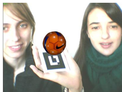
Fig. 5. Interacción con la aplicación con un único marcador. Visualización 3D del objeto.

El alumno, podría aumentar la imagen asociada en cada marcador, presentándolo frente a la cámara web, similar a las actividades de exploración. En la Figura 5, se muestra cómo sería la interacción de un alumno con la aplicación, al mostrar el cartón de la pelota, incluido en la Figura 4 C). Como puede observarse, el objeto que se visualiza es 3D. Además, esta escena aumentada puede estar acompañada de un audio pertinente, si el docente así lo hubiese configurado, acorde a los objetivos de la actividad.