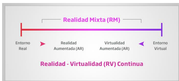
Fig. 1. Definición de realidad aumentada por Milgram y Kishino

Paul Milgram y Fumio Kishino [2] definieron en 1994 el “Reality-Virtuality Continuum” como un continuo que va desde el “entorno real” hasta el “entorno virtual”. Al área comprendida entre los dos extremos, donde se combinan lo real y lo virtual, la denominaron “Realidad Mezclada” (Figura 1).