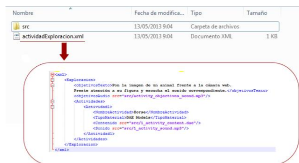
Fig. 3. Estructura del archivo comprimido generado por AuthorAR

El generador (orientada a docentes), está desarrollado en Java y permite crear fácilmente actividades educativas a partir de plantillas. Al momento, se han diseñado dos plantillas: una para actividades de exploración y otra para actividades de estructuración de frases. Para ambos tipos de actividades, la herramienta genera un .zip, que contiene un archivo de especificación en formato XML y una carpeta con los recursos a utilizar en la actividad. En la Figura 3, se puede ver la estructura del archivo comprimido generado por la aplicación y el formato del XML asociado.