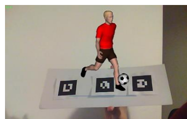
Fig. 6. Actividad de estructuración de frases.

Luego, para realizar el ejercicio de estructuración de frases, el alumno deberá presentar en forma conjunta y ordenada los cartones, de manera tal de componer la frase solicitada. Al presentarlos frente a la cámara web, conjuntamente y en el orden correcto, podrá visualizar al sujeto realizando la acción con el objeto correspondiente (Figura 6). Esto permitirá reforzar el mecanismo de estructuración de frases.