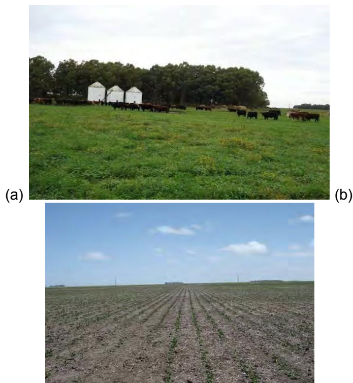
FIGURA 2. Sistemas productivos de la región pampeana argentina: (a) Parches forestales dispersos en un establecimiento mixto familiar; (b) Ausencia de parches forestales en un establecimiento agrícola empresarial.