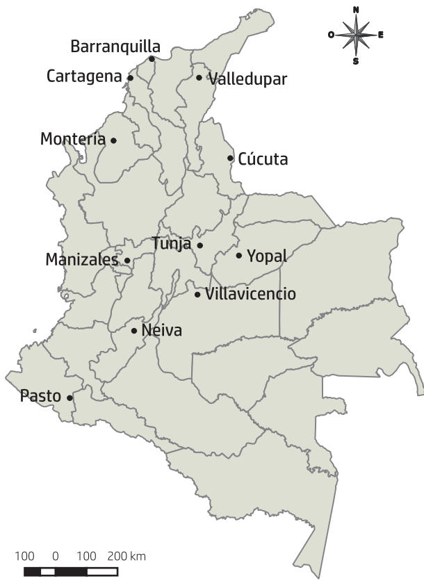
Figura 1. Brigadas realizadas por el Programa Regale Una Vida en Colombia en 2015.