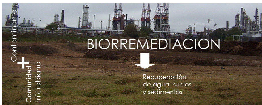
Figura 1: Imagen conceptual de la Biorremediación

La biorremediación, la explotación de las capacidades metabólicas de los microorganismos para degradar contaminantes, tiene hoy en día gran aceptación como una estrategia efectiva, costo-competitiva y ambientalmente amigable para la recuperación de aguas, suelos y sedimentos contaminados [1,2] (Fig. 1). Los microorganismos, y en especial las bacterias, son reconocidos por su amplia capacidad catabólica y su actividad en los procesos de biorremediación, sin embargo la falta de información sobre los factores que controlan el crecimiento y la actividad de los microorganismos en los ambientes contaminados hace que, aún en la actualidad, los procesos de biorremediación tengan resultados impredecibles y que la comunidad microbiana responsable del proceso sea considerada como una “caja negra” [3]. Idealmente, las estrategias de biorremediación deberían ser diseñadas en base al conocimiento de los microorganismos presentes en los ambientes contaminados, sus capacidades metabólicas, y la respuesta a los cambios en las condiciones ambientales [4].