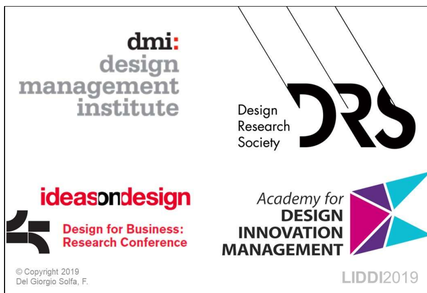
Figura 1. Marco teórico principal

A modo organizador del marco teórico general, el mismo se conformará con tres líneas de trabajo ya emprendidas, en los últimos años, por el director y sus becarios en el lugar de trabajo.