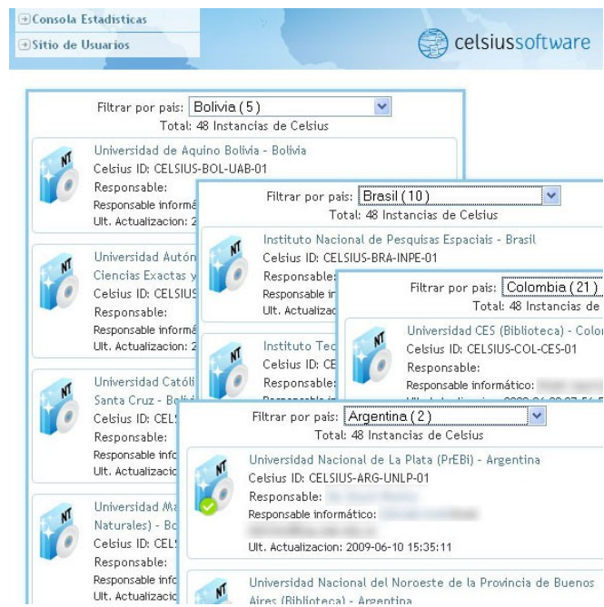
Fig. 1: Listado de Celsius instalados

Desde el lanzamiento de esta versión, el número de instituciones que han instalado y utilizan a diario esta herramienta ha crecido de algo menos de 30 a 48 instancias. El sitio web oficial del software Celsius[5] muestra un listado completo con las instituciones que poseen Celsius funcionando, junto con algunos datos importantes, entre los que se incluyen la versión de Celsius, el identificador global