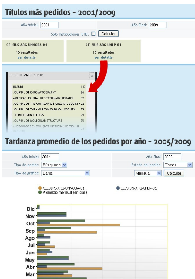
Fig. 4: Directorio Celsius - estadísticas centralizadas

estadística se pueden conocer cuales son las revistas más solicitadas en cada una de las instancias participantes, ofreciendo información muy valiosa a la hora de realizar compras de materiales o suscripciones a revistas y/o catálogos.