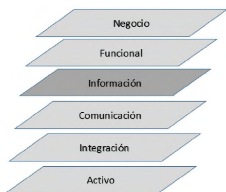
Figura 4. RAMI 4.0 – Eje de la Arquitectura. Niveles de TI

La arquitectura de referencia RAMI 4.0 es una red de componentes interconectados todos entre todos mediante el “ Administration Shell ” que contiene los datos de la representación virtual de un objeto del mundo real con sus características y funcionalidades propias [21].