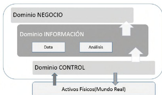
Figura 3. Dominio de Información - Flujo de Datos

El volumen de datos de los procesos industriales digitalizados demanda una extraordinaria capacidad de cómputo, facilidades de acceso desde cualquier lugar y diferentes tipos de dispositivos, alta disponibilidad y flexibilidad, razón por la cual cloud computing está considerado como un habilitador de la Industria 4.0. De acuerdo con la demanda de recursos de cómputo y almacenamiento, las industrias pueden elegir entre el servicio de Infraestructura como Servicio (IaaS), Plataforma como Servicio (PaaS) o Software como Servicio (SaaS). La adopción del cloud computing en entornos de fabricación se extiende debido a la facilidad de configurar redes públicas, privadas o híbridas para