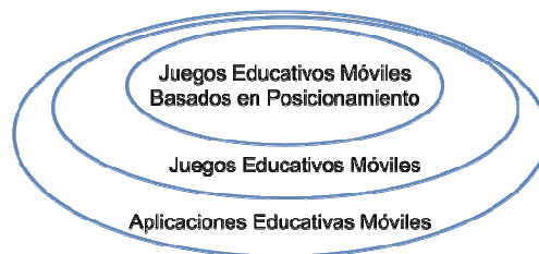
Fig. 1. Juegos Educativos Móviles basados en posicionamiento

En este trabajo, se abordarán los JEMBP, donde de acuerdo a [14], el alumno se encuentra en movimiento durante la experiencia del juego. En la Figura 1, se puede apreciar, la relación de inclusión de este tipo de juegos en relación con otros conceptos previamente presentados.