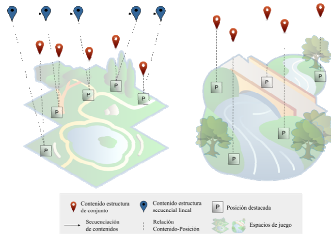
Fig. 2. Reuso de los aspectos de contenido y movilidad

En los aspectos presentados en esta sección no se abordó la temática de cómo presentar los mismos al alumno. Esto será presentado en la siguiente sección.