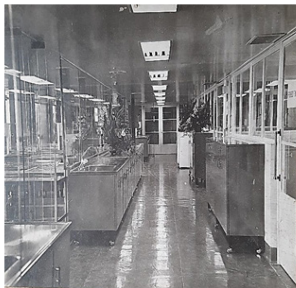
Día de inauguración del Servicio (27/09/72)