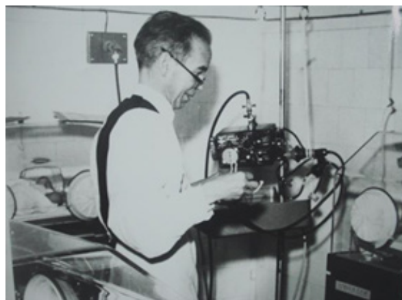
Incubadoras Isolette y el primer respirador "Bird" Marck 8 en la Sala V.