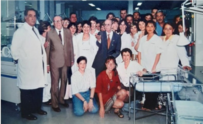
25° Aniversario, en el que se impuso su nombre al Servicio de Neonatología

cios de Neonatología diseminados en distintos puntos del país.