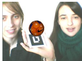
Fig. 5. Interacción con la aplicación con un único marcador. Visualización 3D del objeto.

El alumno, podría aumentar la imagen asociada en cada marcador, presentándolo frente a la cámara web, similar a las actividades de exploración. En la Figura 5, se muestra cómo sería la interacción de un alumno con la aplicación, al mostrar el cartón de la pelota, incluido en la Figura 4 C). Como puede observarse, el objeto que se visualiza es 3D. Además, esta escena aumentada puede estar acompañada de un audio pertinente, si el docente así lo hubiese configurado, acorde a los objetivos de la actividad.