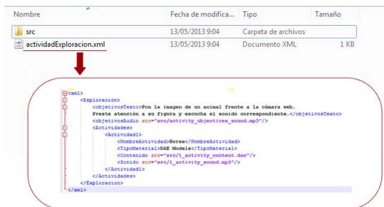
Fig. 3. Estructura del archivo comprimido generado por AuthorAR

El generador (orientada a docentes), está desarrollado en Java y permite crear fácilmente actividades educativas a partir de plantillas. Al momento, se han diseñado dos plantillas: una para actividades de exploración y otra para actividades de estructuración de frases. Para ambos tipos de actividades, la herramienta genera un .zip, que contiene un archivo de especificación en formato XML y una carpeta con los recursos a utilizar en la actividad. En la Figura 3, se puede ver la estructura del archivo comprimido generado por la aplicación y el formato del XML asociado.