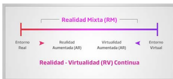
Fig. 1. Definición de realidad aumentada por Milgram y Kishino

Paul Milgram y Fumio Kishino [2] definieron en 1994 el “Reality-Virtuality Continuum” como un continuo que va desde el “entorno real” hasta el “entorno virtual”. Al área comprendida entre los dos extremos, donde se combinan lo real y lo virtual, la denominaron “Realidad Mezclada” (Figura 1).