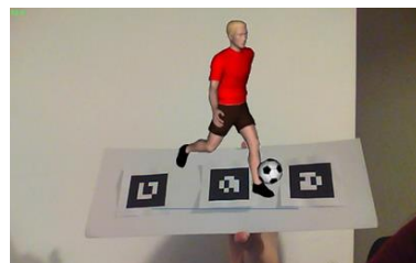
Fig. 6. Actividad de estructuración de frases.

Luego, para realizar el ejercicio de estructuración de frases, el alumno deberá presentar en forma conjunta y ordenada los cartones, de manera tal de componer la frase solicitada. Al presentarlos frente a la cámara web, conjuntamente y en el orden correcto, podrá visualizar al sujeto realizando la acción con el objeto correspondiente (Figura 6). Esto permitirá reforzar el mecanismo de estructuración de frases.